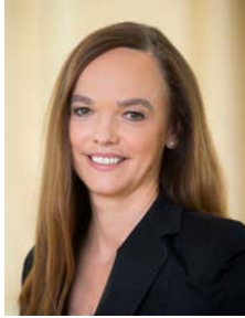
Dr. in Sonja Hammerschmid

Ein wesentliches Ziel der Bildungsreform ist es, allen Kindern einen guten Start in ein gemeinsames Schulleben zu ermöglichen. Das gelingt nur, wenn man die vielfältigen Interessen und Begabungen sobald wie möglich erfasst, Freude und Neugier der Kinder auf die Schule anspricht und direkt an die Entwicklungs- und Lernprozesse aus dem Kindergarten anschließen kann.